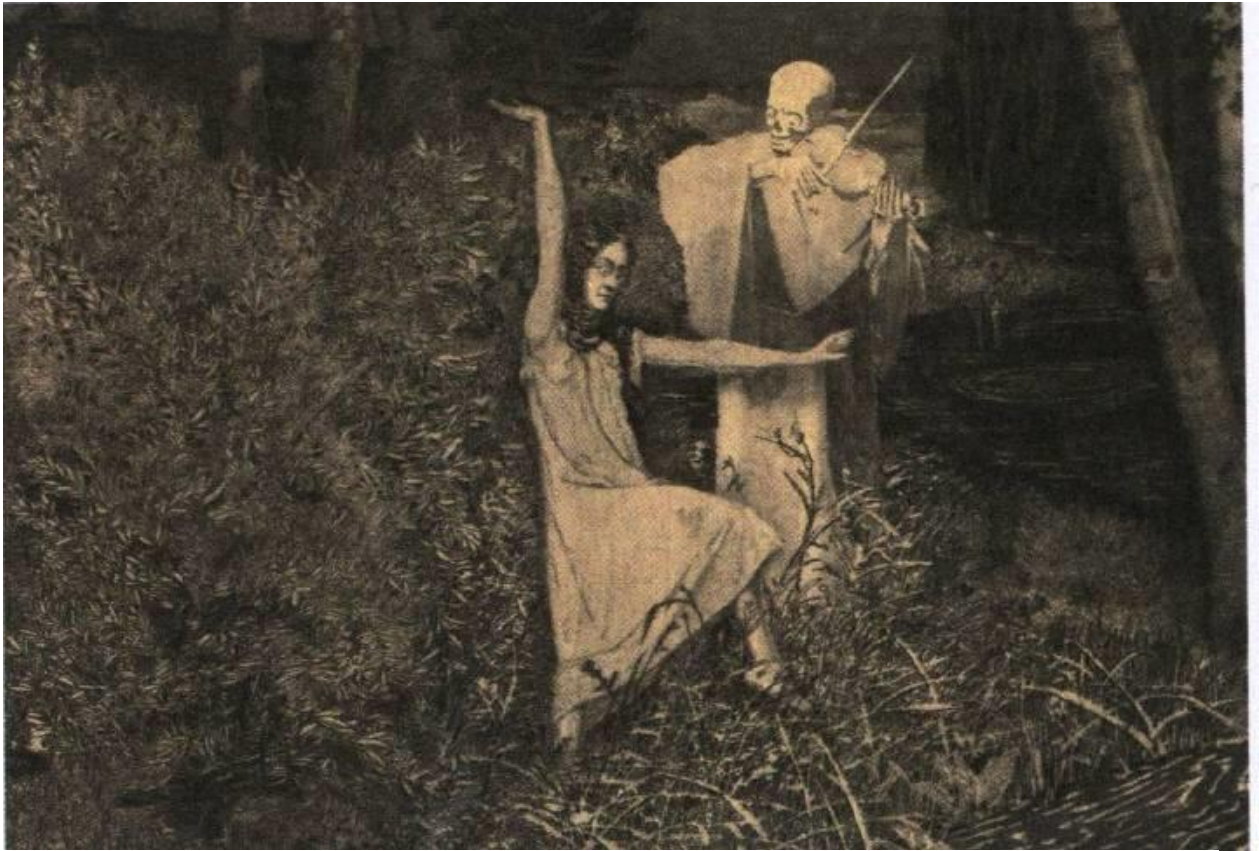
BRÖMSE, August. The girl and the death. Berlin, 1902. (National Gallery Prague). Disponível em: < http://www.victorianweb.org/decadence/painting/bromse/5.html > Acesso em: 07 ago. 2012.